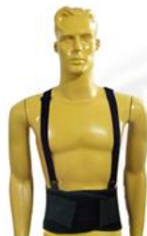
CINTO ECO FLEX