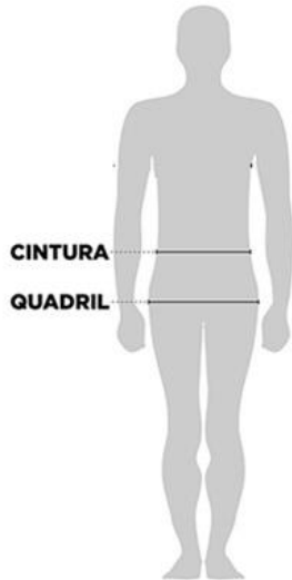
TABELA DE TAMANHOS CINTOS ABDOMINAIS Color Flex, Eco Flex, Uniflex, Belt e Dorsal.