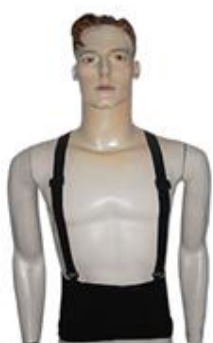
CINTO COLOR FLEX