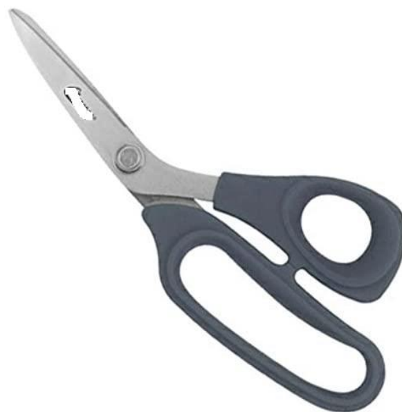
8" Titanium Bent Kevlar Shear

Para corte do material utilizar nossa tesoura específica