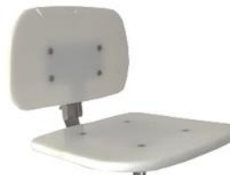
100 % PEAD maciço