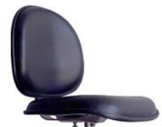
Espuma revestida em VINIL EXTRA

Explicação detalhada da linha Golden Clean – https://mundoergonomia.com.br/info/linha-golden-clean-inox-aisi-304/