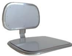
INOX revestidos com camada PEAD