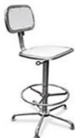
INOX AISI 304 REVESTITO COM PEAD