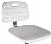
PU integral SKIN-WDA branca