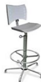
PLASTICO DE ENGENHARIA