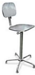
INOX AISI 304