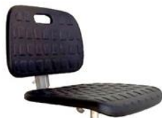
PU integral SKIN-WDA preta