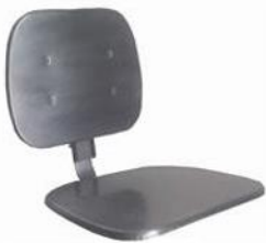
100 % INOX AISI 304