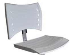
Injetado em Polipropileno