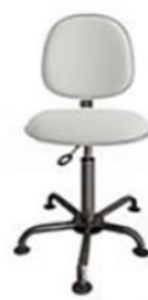
ESPUMA REVESTIDA COM CURVIN