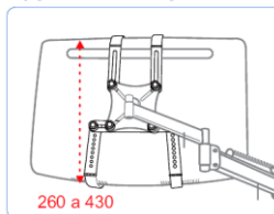
Opções de instalação

Kit é composto de 4 garras sendo duas com furo oblongo e duas com 10 furos redondos e um prolongador que possibilita a instalação com variações de largura de 260 a 440 mm e altura de 260 a 430 mm. Fabricado totalmente em chapa de aço carbono, com pintura epóxi e acabamento em espuma de E.V.A. nas partes em contato com o monitor. Cor: Preta Capacidade de carga: 6 kg Monitores: 15 a 22 polegadas Peso: 0,350 kg